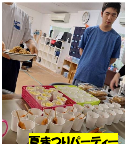
夏まつりパーティー