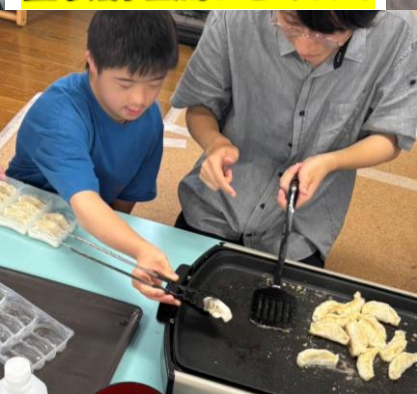
昼食調理流しそうめん