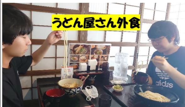
うどん屋さん外食

食事は最高の楽しみ！ 毎日出来る限り一人一人のリクエストに応えられるように工夫しています。